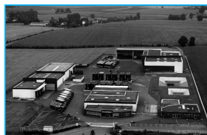
Plate-forme de collecte et de regroupement de Javené qui intègre l'unité de valorisation des filtres à huile

Ses 731 collaborateurs intègrent 95 technico-commerciaux à l'écoute permanente des besoins des industriels, des collectivités et du monde automobile en matière de collecte et de traitement des déchets issus de leur activité.